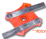
**Rotor em estrela